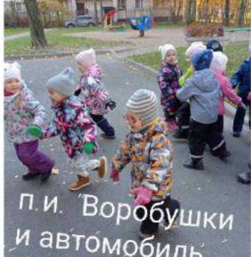
п.и. "Воробушки и автомобиль"