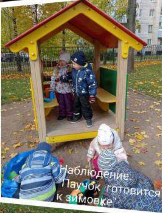
Наблюдение. Паучок готовится к зимовке'