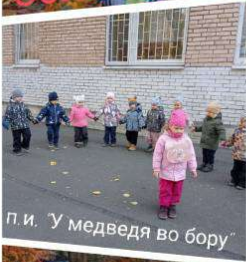
п.и. "У медведя во бору"