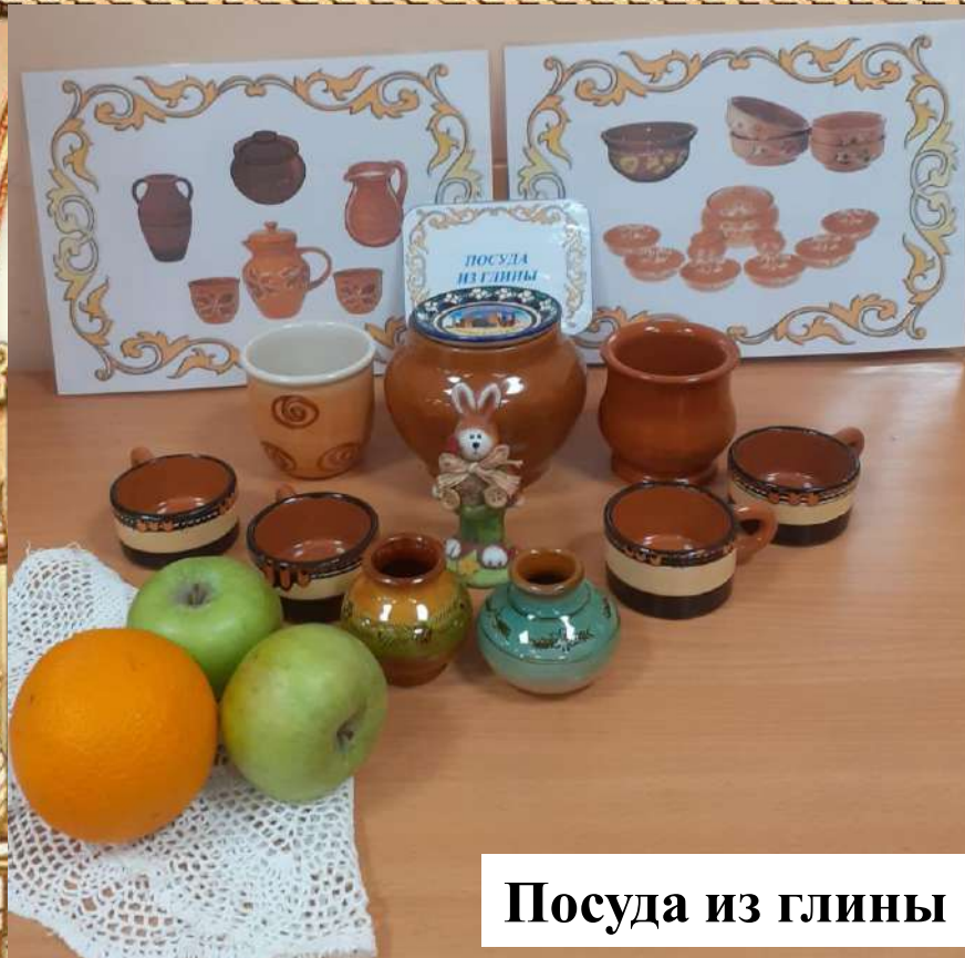
Посуда из глины