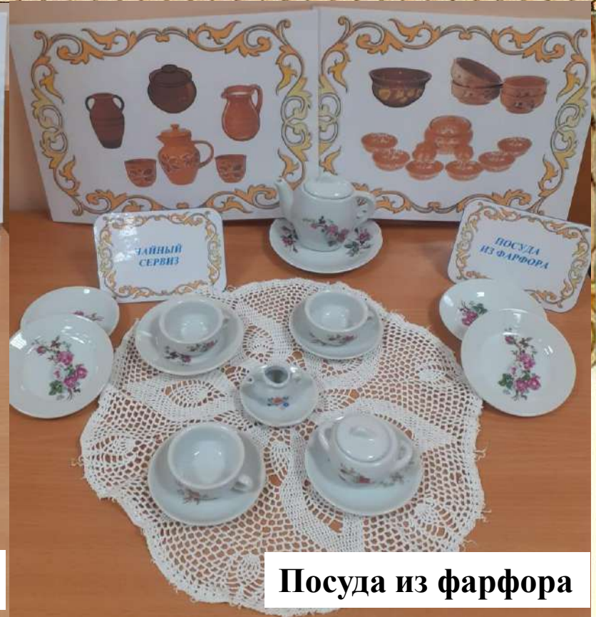
Посуда из фарфора