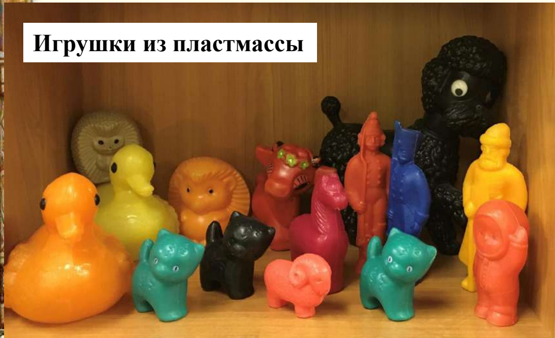
Игрушки из пластмассы