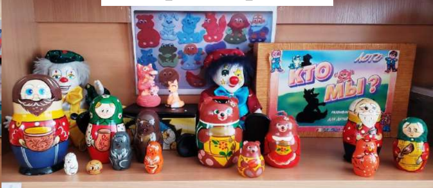
Театр - матрёшка