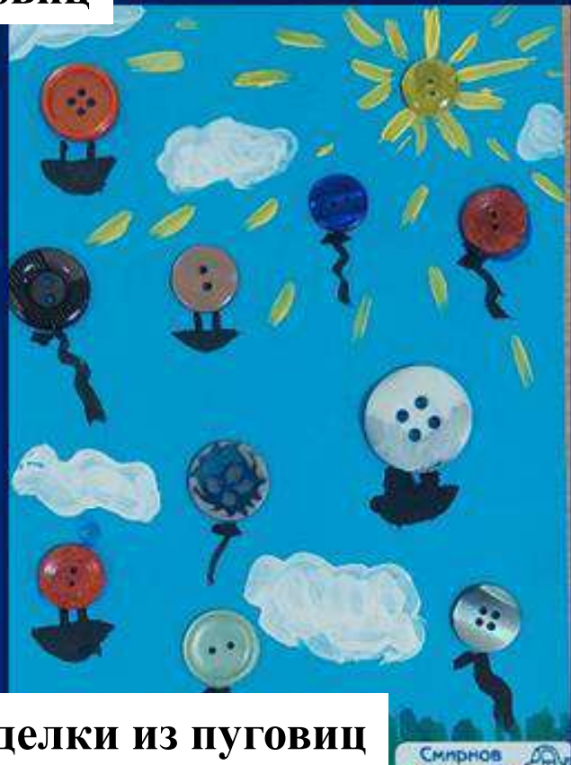
Поделки из пуговиц