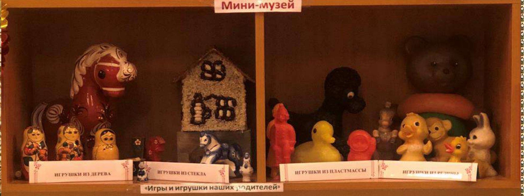
ИГРУШКИ ИЗ ДЕРЕВА