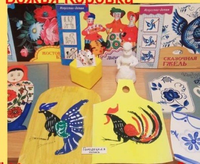
Мини-музей "Народные мастера"