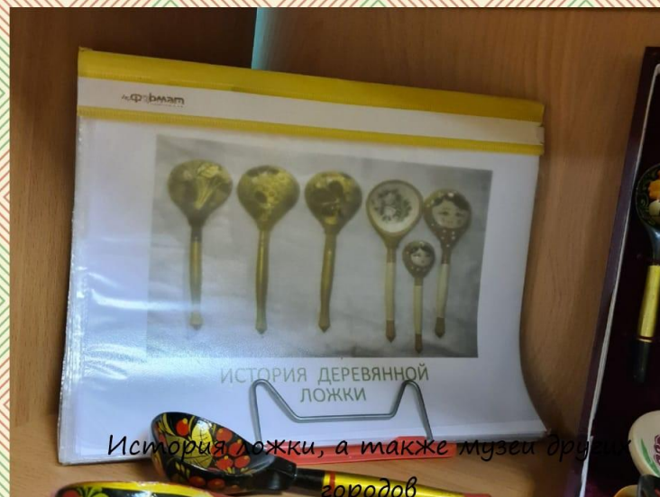
История ложки, а также музеи других городов